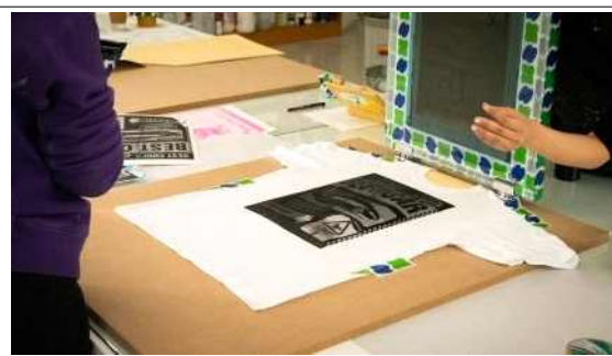
2025 경기상상캠퍼스 교육 프로그램 예시 사진