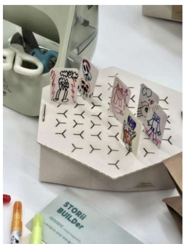
교육프로그램 체험활동 예시