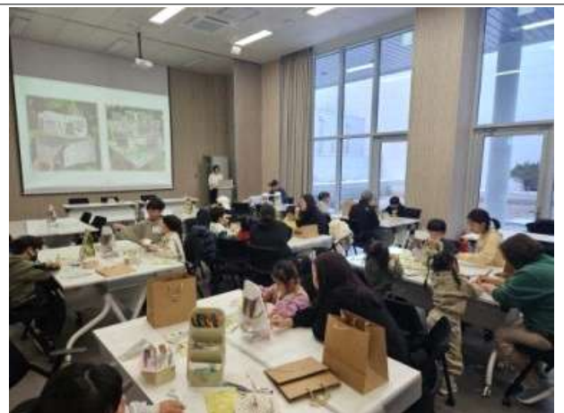
남한산성역사문화관 강당 체험활동 예시