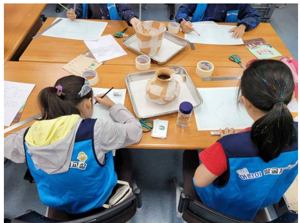
▲ 발굴체험교실 <선사인의 발명품> 프로그램 운영 사진