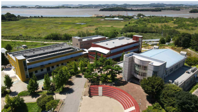
경기창작캠퍼스 생활문화센터 전경 사진