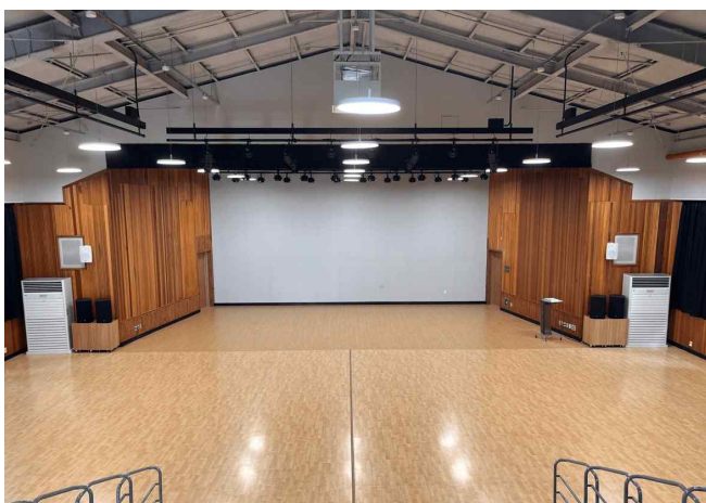
경기창작캠퍼스 선감아트홀 공연장 사진