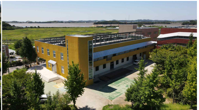
경기창작캠퍼스 생활문화센터 전경 사진